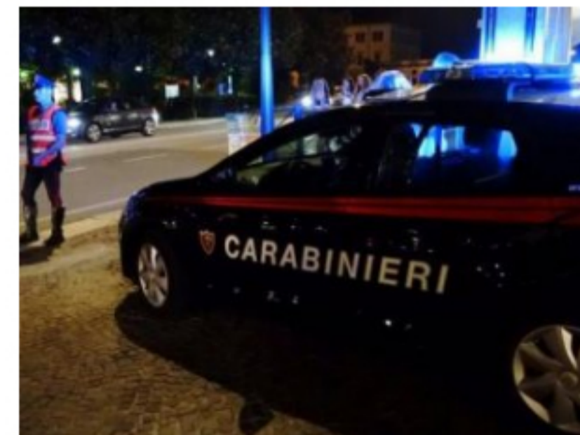
Eur, proseguono i controlli dei Carabinieri al Trullo, Magliana e Corviale