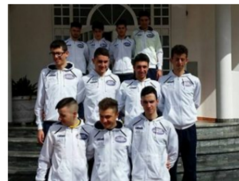
Ciclismo, Team Coratti, la squadra Juniores ha cominciato la settimana di ritiro a Terracina